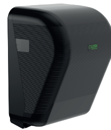
REF: CP-3525-MT Colour NOIR MAT