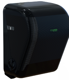
REF: CP-3525-BL Colour NOIR