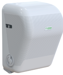
REF: CP-3525-B Colour BLANC